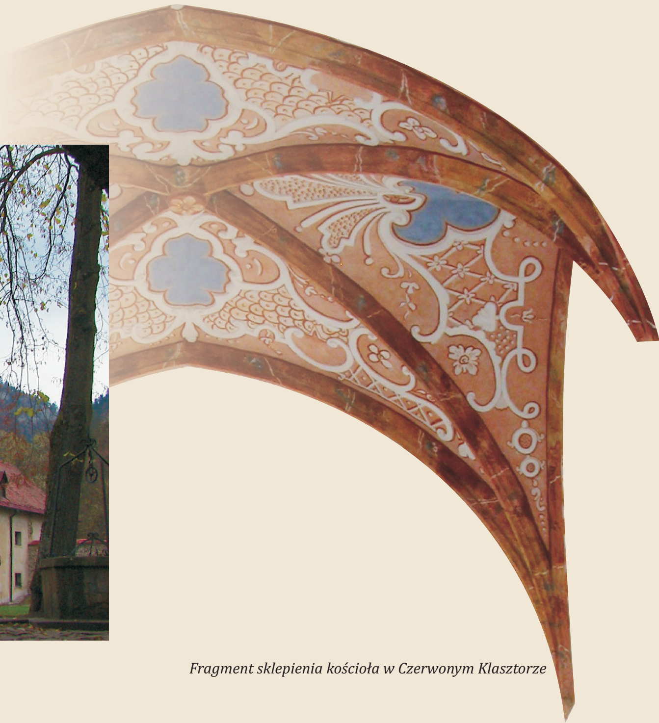
Fragment sklepienia kościoła w Czerwonym Klasztorze