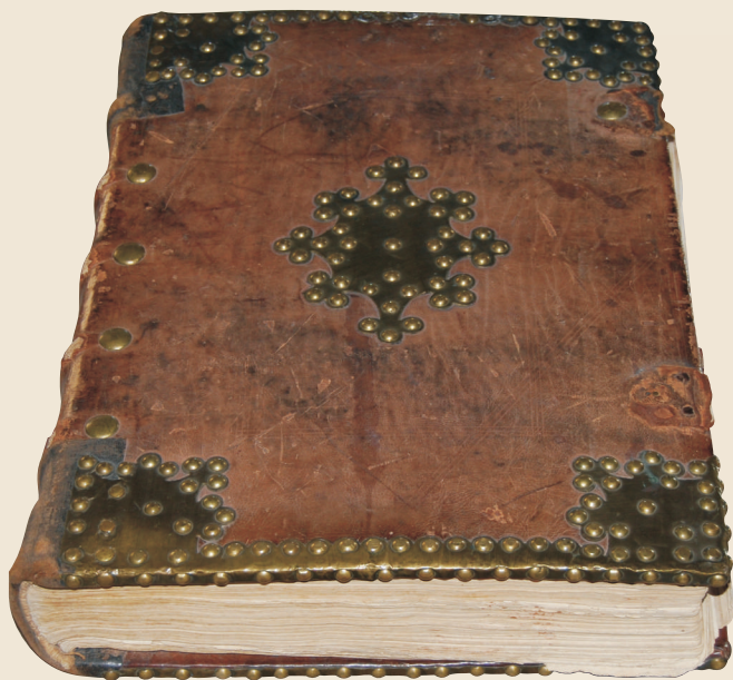
Antyfonarz z 1612 roku

W okresie od XIV do XVI wieku wspólnoty kartuzów na Spiszu znajdowały się w Kłáštorisku w Słowackim Raju i w Czerwonym Klasztorze. Kartuzi słynęli z przepisywania ksiąg. Wykonywali także ich oprawy. Na wystawie można obejrzeć m.in. oryginalną księgę liturgiczną - antyfonarz z 1612 roku, czyli zbiór antyfon (antyfona - naprzemienny śpiew celebransa i zgromadzonych na nabożeństwie).