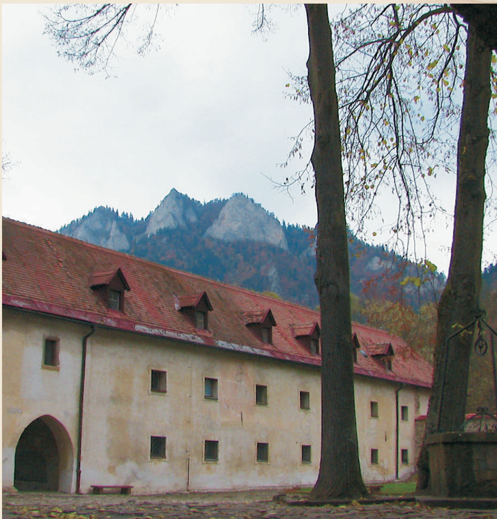
Czerwony Klasztor w Pieninach