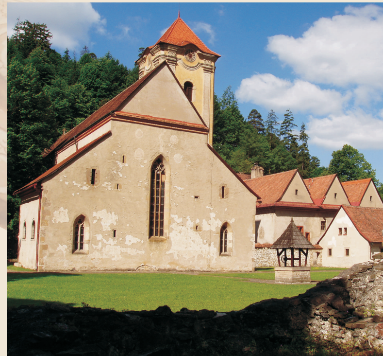
Zespół klasztorny w Czerwonym Klasztorze

W ystawa „Dialogi“, przygotowana przez Słowaków i Francuzów, składa się z kilku części. Główna, prezentująca życie codzienne w klasztorach cysterskim, kartuzjańskim i kamedulskim, nosi nazwę "Cystersi, kartuzi i kameduli na Spiszu".