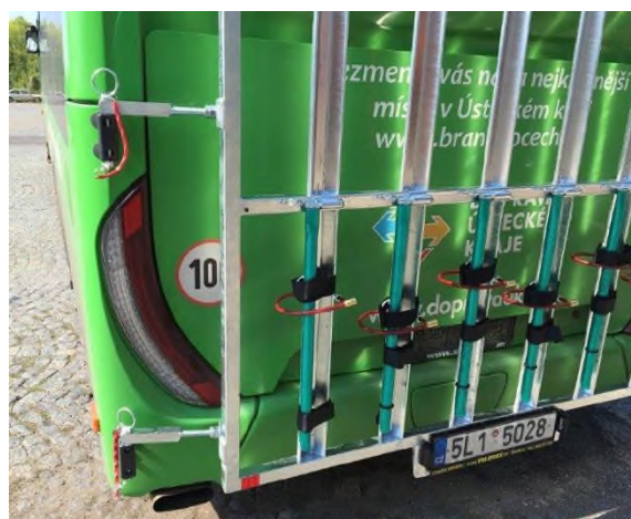
Obrázok č. 2