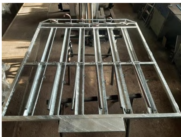
Obrázok č. 1

Plánované nasadenie CykloBusov v roku 2022 je pilotný projekt, na základe ktorého by sa pokračovalo aj v nasledujúcich sezónach. Podľa záujmu verejnosti o CykloBusy je v budúcnosti možné aj nasadenie CykloVozíkov , ktoré budú disponovať väčšími prepravnými kapacitami oproti samotným nosičom na bicykle.