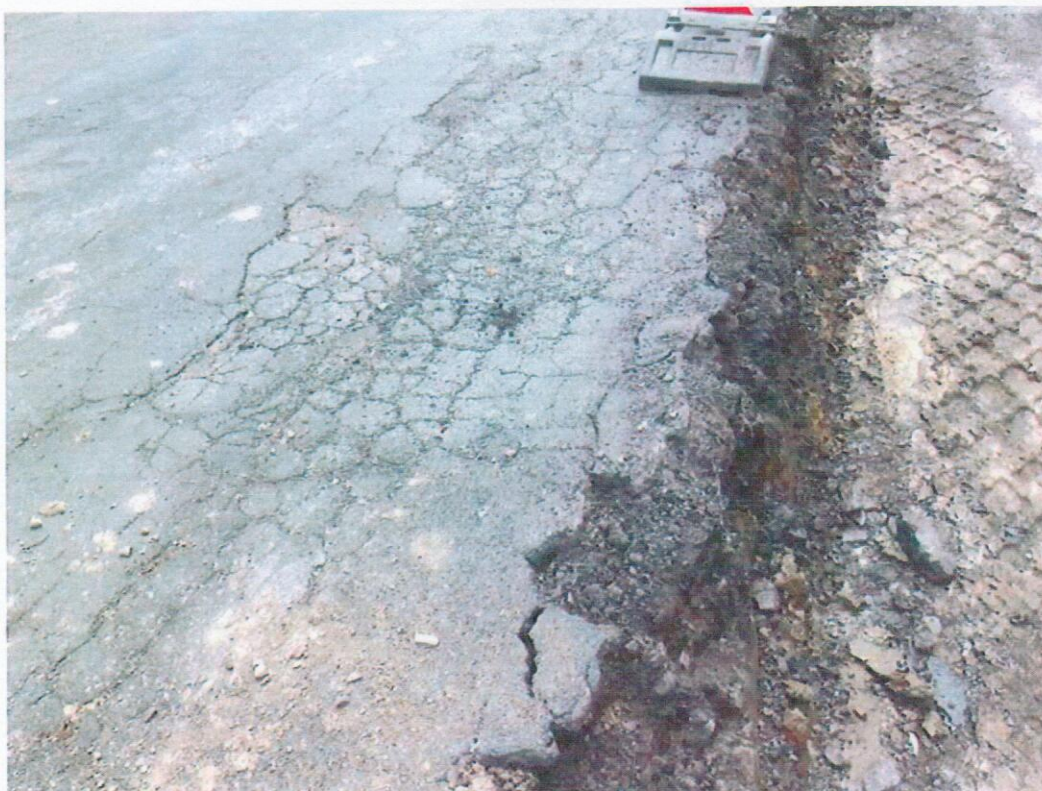
Obr. 5 Stav pôvodnej vozovky a podložie v mieste rozšírenia pôvodnej vozovky