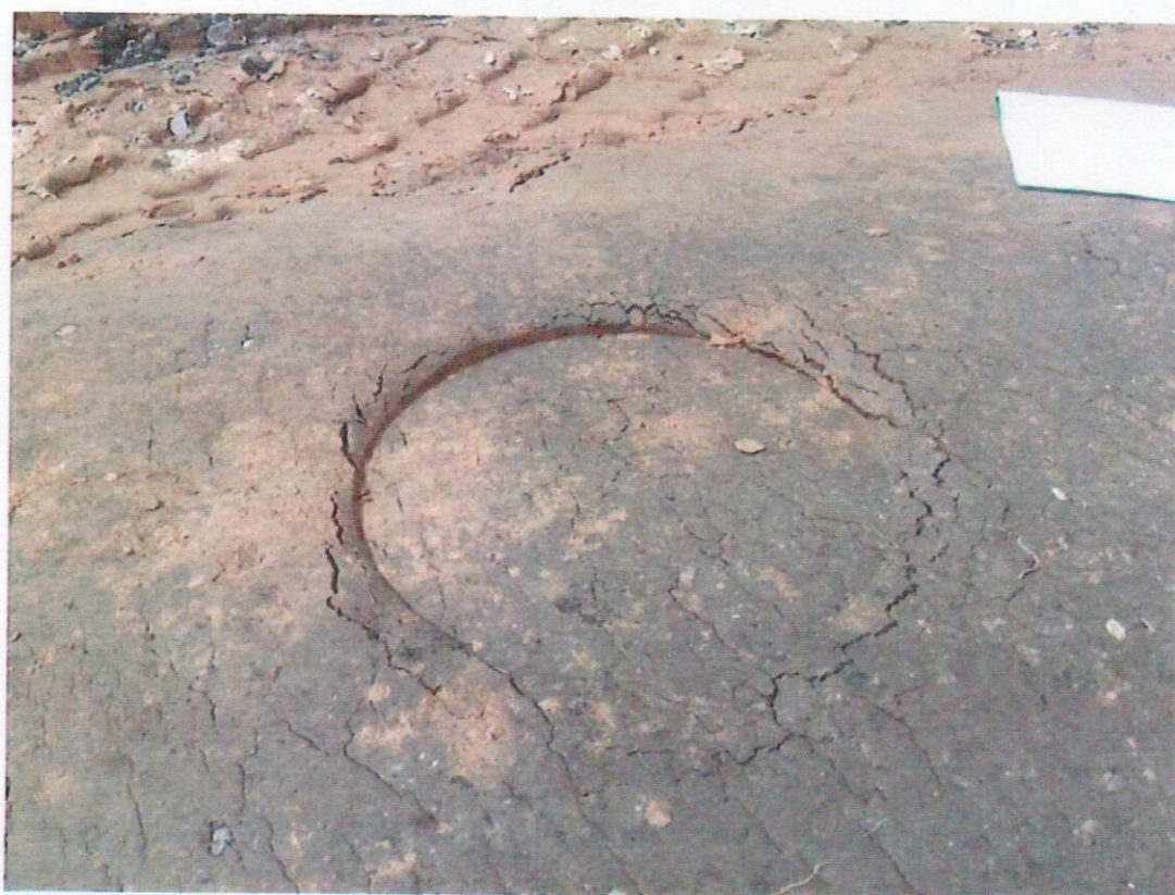
Obr. 4 Neúnosné podložie v miestach rozšírenia pôvodnej vozovky