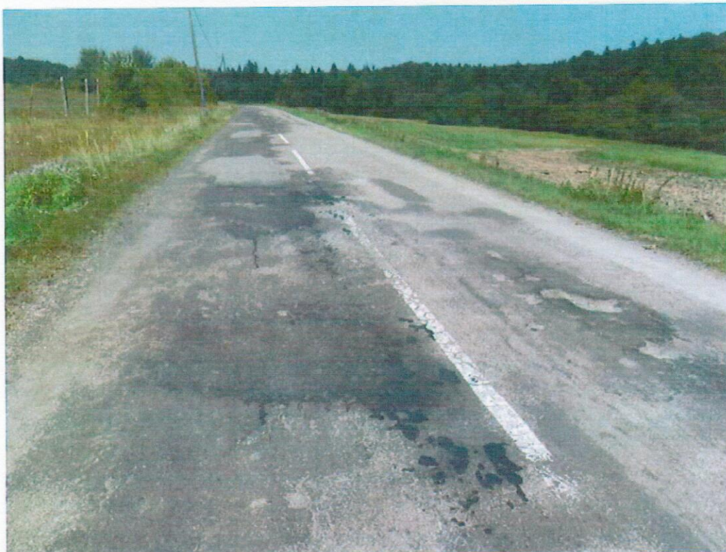
Obr. 1 Stav povrchu pôvodnej konštrukcie vozovky