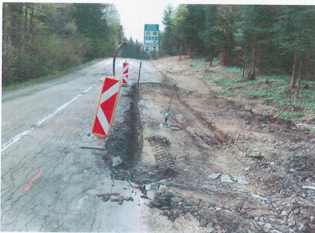
Obr. 3 Meranie únosnosti v miestach rozšírenia pôvodnej vozovky