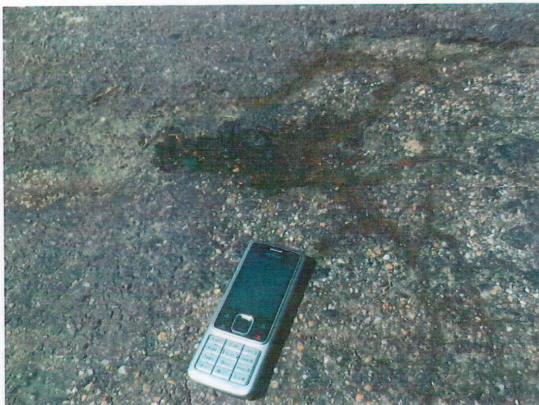
Obr. 2 Vytokanie vody z konštrukcie pôvodnej vozovky