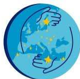
European Neighbourhood Policy

Sieť NEEBOR nadviazala na svoje stanovisko k cezhraničnému komponentu ENPI a rokovala so zástupcami DG AIDCO a DG DEVCO o aktuálnom vývoji prípravy tohto nástroja susedskej politiky EÚ. V rámci diskusie boli predstavené návrhy EK a otvorené problematické oblasti v procese implementácie. K danej téme odznel príspevok predstaviteľky DG DEVCO na výročnej konferencii NEEBOR. Vývoj v tejto oblasti je priebežne konzultovaný s Odborom cezhraničných programov PSK. Prvé rokovania medzi členskými štátmi a EK prebehli, negociácie sa prenášajú na úroveň programov. Slovensko bude mať oprávnené územie hraničiace s Ukrajinou opäť v programe štyroch krajín Maďarsko-Slovensko-Rumunsko-Ukrajina aj v období 2014-2020.