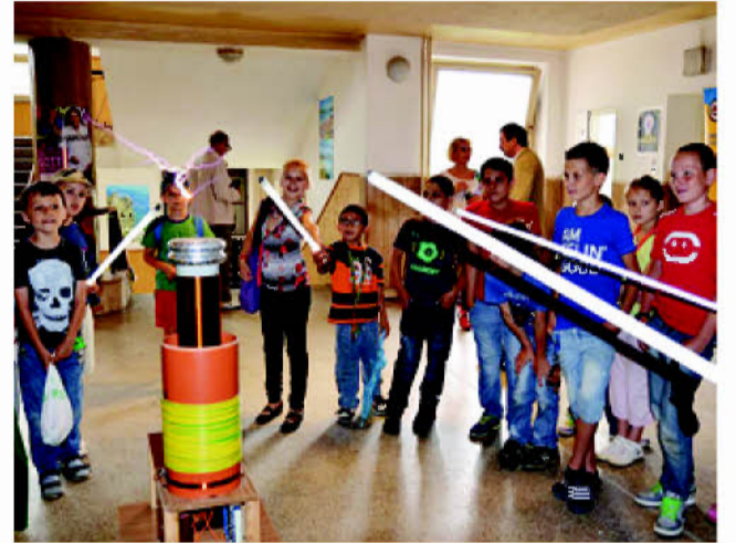
Mnohé aktivity počas Energetického dňa sú určené pre deti.

Sprievodné akcie Energetického dňa budú prebiehať aj v zariadeniach v zriaďovateľskej pôsobnosti PSK (stredné školy, domovy sociálnych služieb a kultúrne zariadenia) na území prešovského regiónu počas celého mesiaca jún.