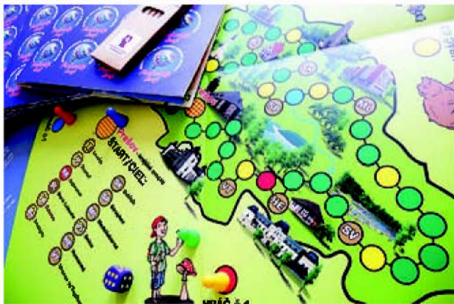
Darčekový balíček pre malých turistov tvorí špeciálna spoločenská hra o Prešovskom kraji, pexeso a omalovánka