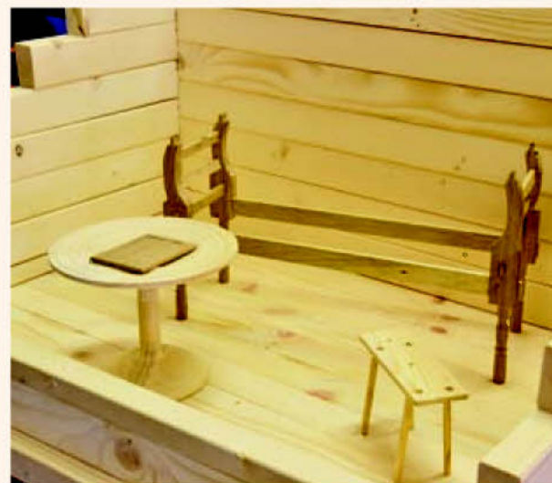
Drevenú maketu kniežacej hrobky z Popradu vytvorili študenti kežmarskej umeleckej školy.

Súťažnú prácu budú kežmarskí študenti obhajovať v celoštátnom kole SOČ koncom apríla v Piešťanoch.