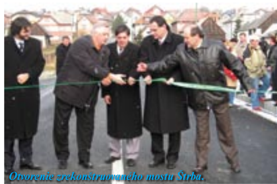
Otvorenie zrekonštruovaného mostu Štrba.