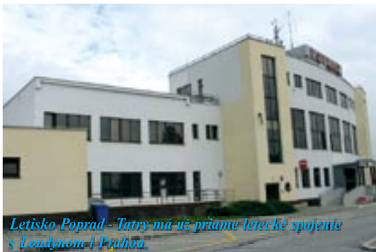
Letisko Poprad - Tatry má už priame letecké spojenie s Londýnom i Prahou.