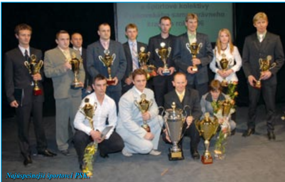
Najúspešnejší športovci PSK.